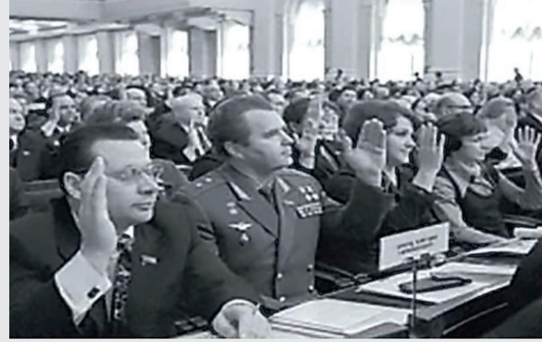
Депутаты Верховного Совета СССР голосуют в ходе одной из сессий Верховного Совета СССР 1976 г.

Герой Социалистического Труда, депутат Верховного Совета СССР VI созыва от Калининской области