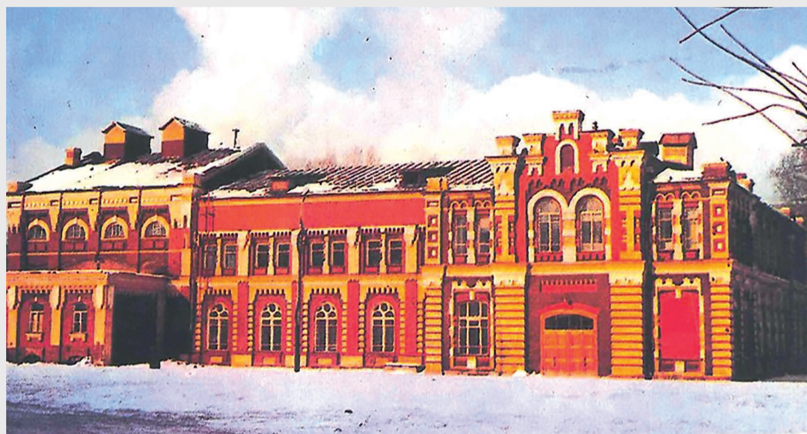
Здание Большого Пролетарского театра, где прошел первый Тверской окружной Съезд Советов

Тверской округ просуществовал всего год, но за этот период было введено всеобщее начальное обязательное обучение, в городах области — обязательное семилетнее обучение, выросла сеть лечебно-профилактических учреждений, высокими темпами развивалось промышленное и сельскохозяйственное производство.