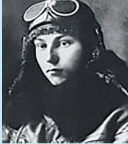
ПОКРЫШКИН Александр Иванович (1913-1985)

работница советской лёгкой промышленности, ткачиха Калининского хлопчатобумажного комбината, Герой Социалистического Труда, депутат Верховного Совета СССР V созыва от Калининской области