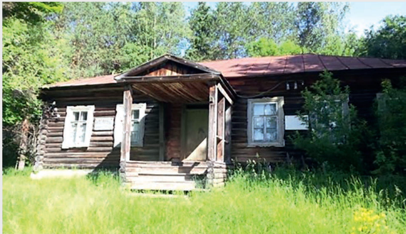
Новинский волостной крестьянский Совет