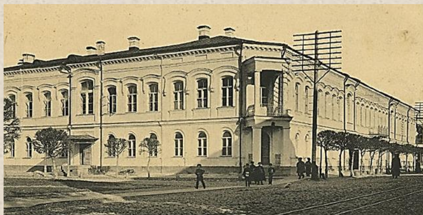
Здание реального училища в Твери (ныне Тверской Государственный объединенный музей)

Для более удобного размещения Общественного Собрания средняя часть Гостиного двора была надстроена. Здесь проходили музыкальные вечера литературно-музыкального общества «Ладо», спектакли труппы любителей, служащих и рабочих фабрики Тверской мануфактуры, концерты духовых оркестров воинских частей. Общественное собрание действовало вплоть до 1917 г.