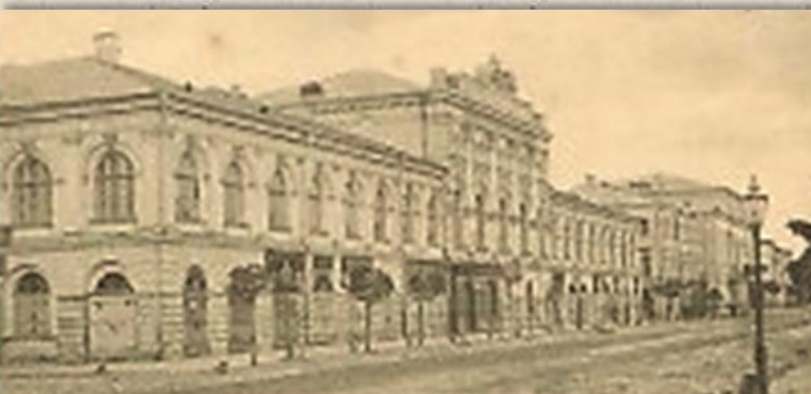
Здание Тверской Городской думы

Для более удобного размещения Общественного Собрания средняя часть Гостиного двора была надстроена. Здесь проходили музыкальные вечера литературно-музыкального общества «Ладо», спектакли труппы любителей, служащих и рабочих фабрики Тверской мануфактуры, концерты духовых оркестров воинских частей. Общественное собрание действовало вплоть до 1917 г.