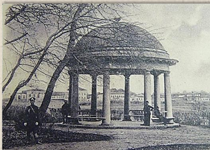
Беседка-ротонда в Губернаторском саду.

13 апреля 1832 г. Указом Николая I установлено сословие «почетных граждан» (с разделением на личное и потомственное). Прежние «первостатейные купцы и именитые граждане» - отменены.