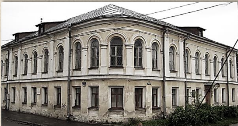
Музей М.Е. Салтыкова-Щедрина, бывший дом чиновников Врасского и Юргенсона, по проекту К. Гейденрейха

1834 г. Предводитель дворянства выразил тревогу, что многие дети уездных дворян не умеют даже читать и писать. Было поручено архитектору К. Гейденрейху спроектировать гимназию. Строительство ее длилось более 10 лет (ныне здание Медицинского университета).