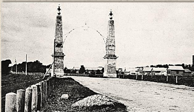
Московская застава в Твери, возведенная по проекту губернского архитектора

1842 г. Твери принадлежали Общественные сады: Парк-Воксал, Губернаторский сад, Палисад в Заволжской части на берегу Волги, Мироносицкий бульвар (ныне бульвар Радищева), обсажен березками. Замощено 20 улиц и площадей в Твери.