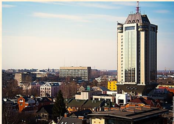
Гостиница «Панорама» на Смоленском переулке