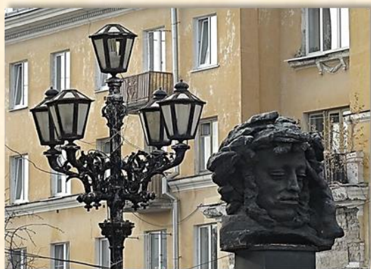
Памятник А.С. Пушкину (скульптор Е.Ф. Белашова) на Театральной площади

1978-1980 гг. Открыт второй (тоже безымянный) мост через р. Тверцу, новые здания Главпочтамта и Дворца пионеров.