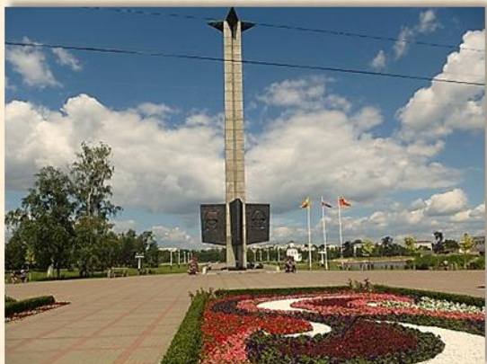
Обелиск в честь победы в Великой Отечественной войне

1970 г. Пущен в эксплуатацию новый широко-экранный кинотеатр «Россия».