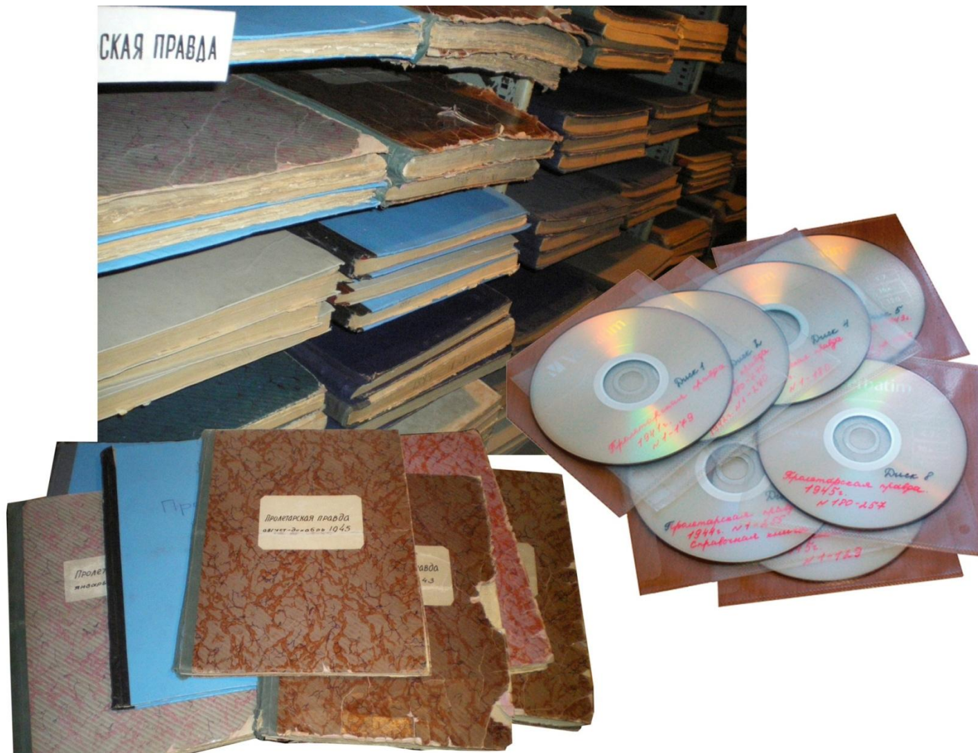
Оригиналы газет и их электронные копии