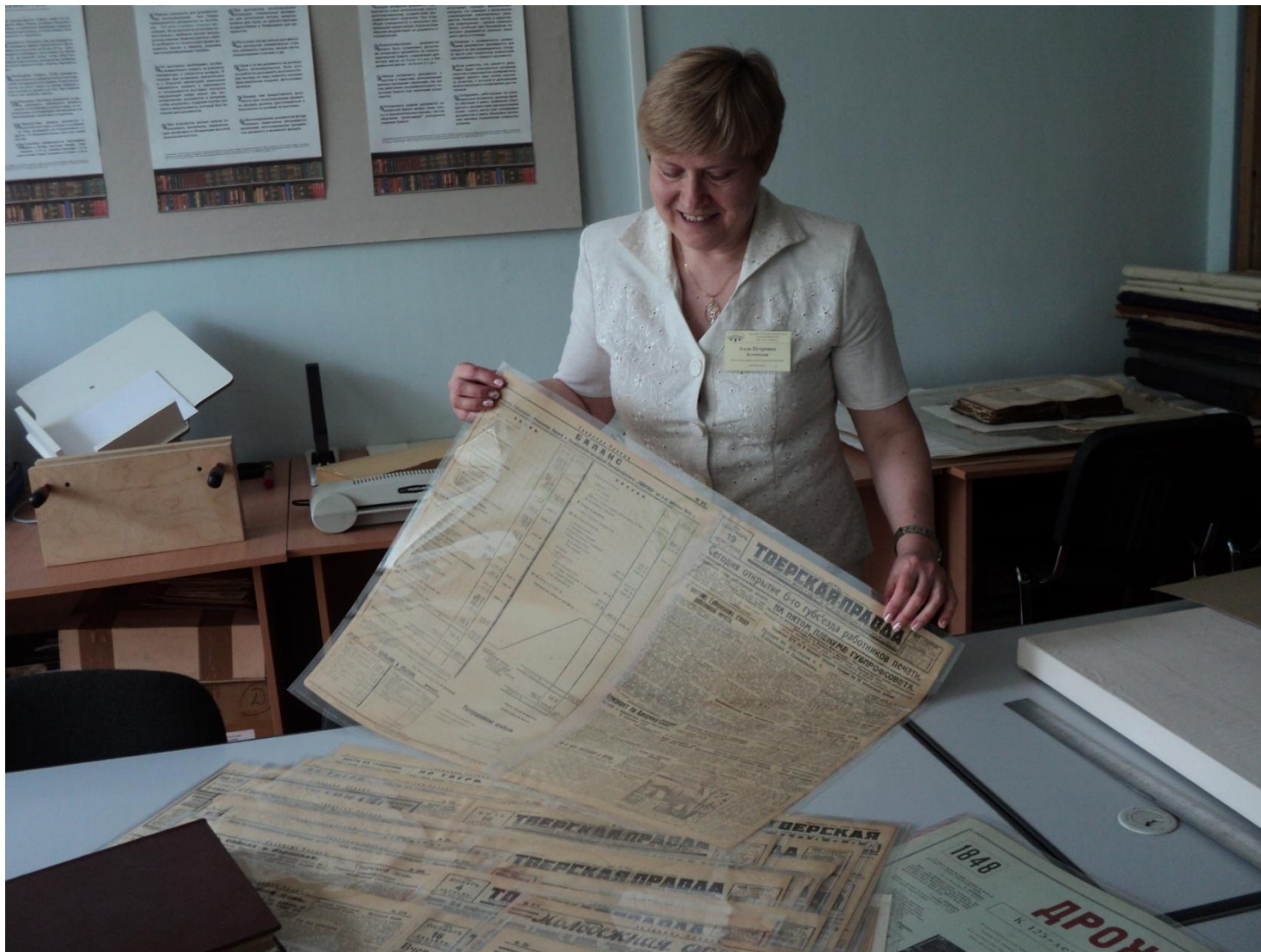
Восстановленные газеты (инкапсулирование, нейтрализация, реставрация)