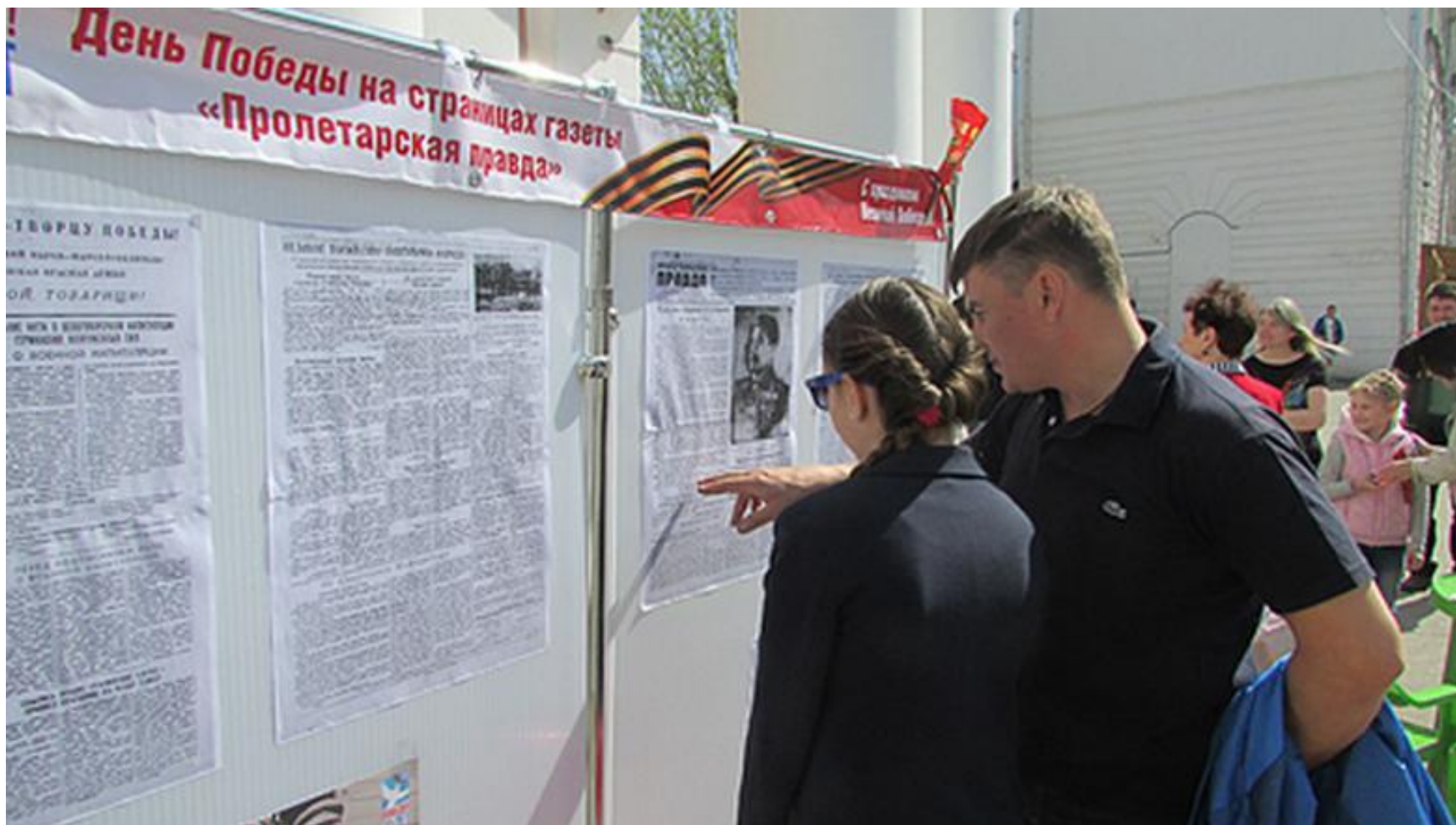
Газета «Пролетарская жизнь» военных лет на улицах Твери