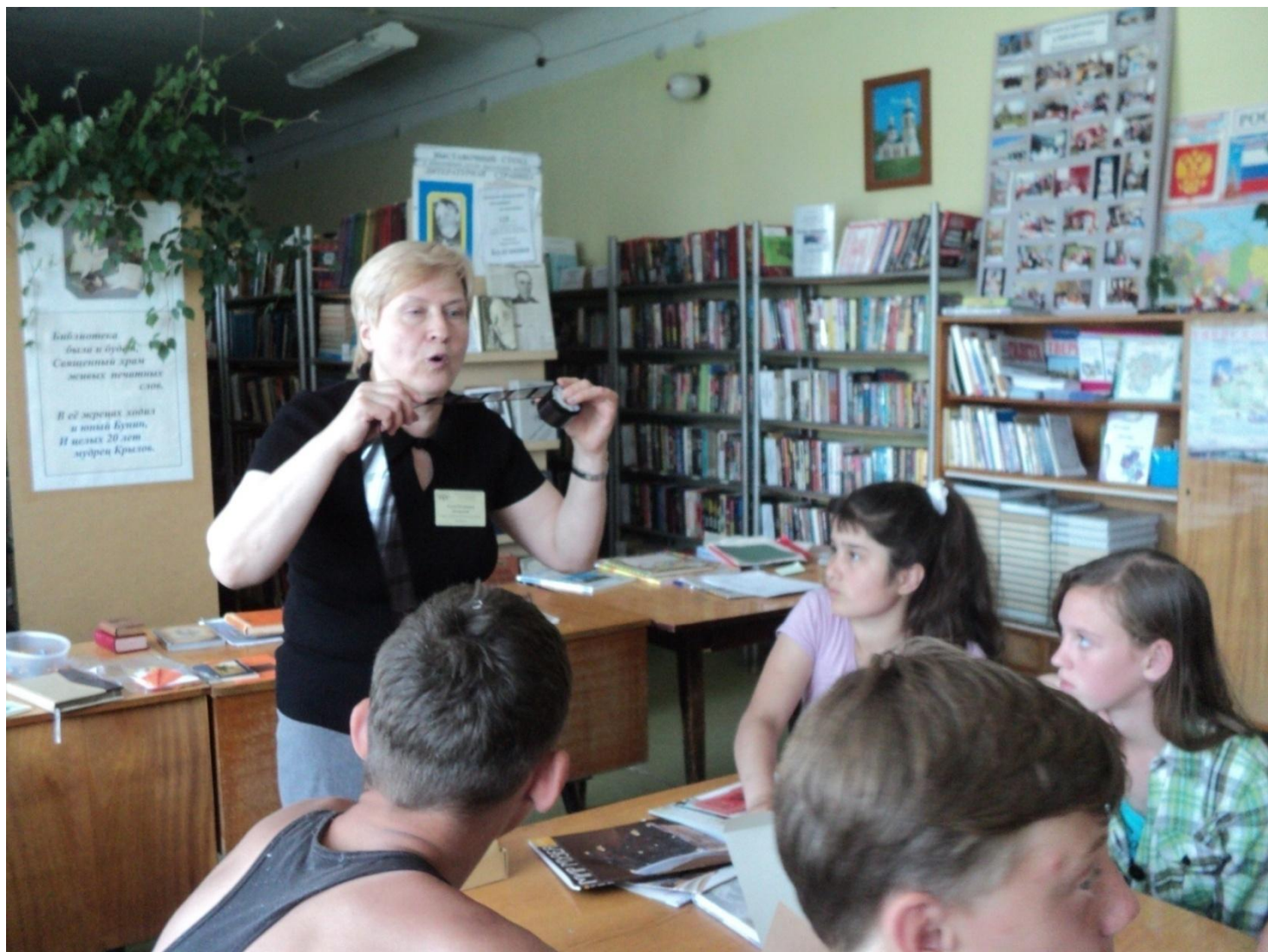
Школьникам о микрофильмировании. В библиотеке посёлка Орша Калининского района