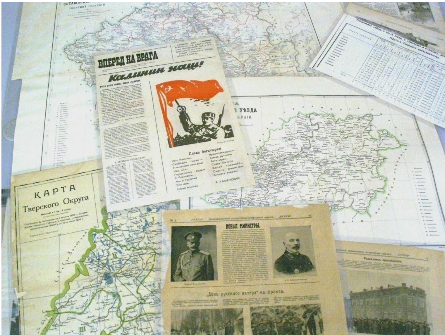
Газеты, карты, схемы, прошедшие консервационную обработку