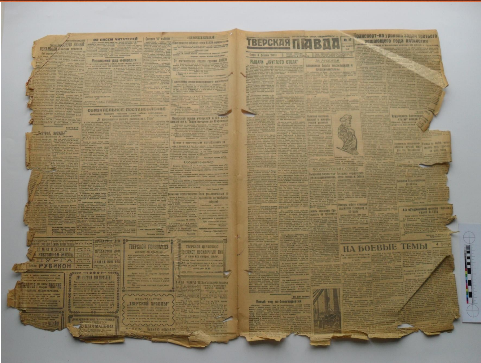
«Тверская правда», 1931 г. Заломы листа, разрывы