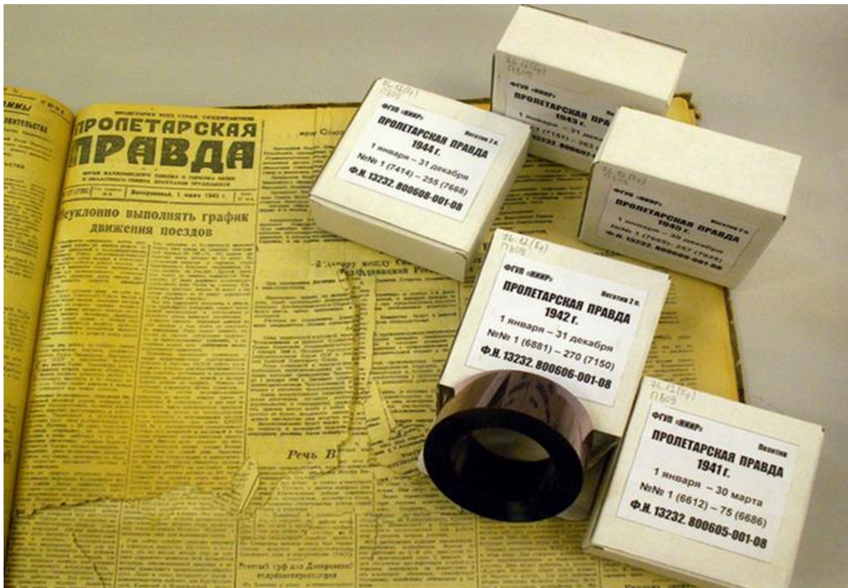
Микрофильмы газеты «Пролетарская правда» ( 1941-1945 гг.)