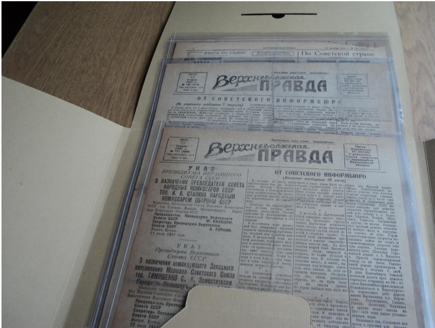
Инкапсулирование и фазовая консервация районной газеты Тверской области