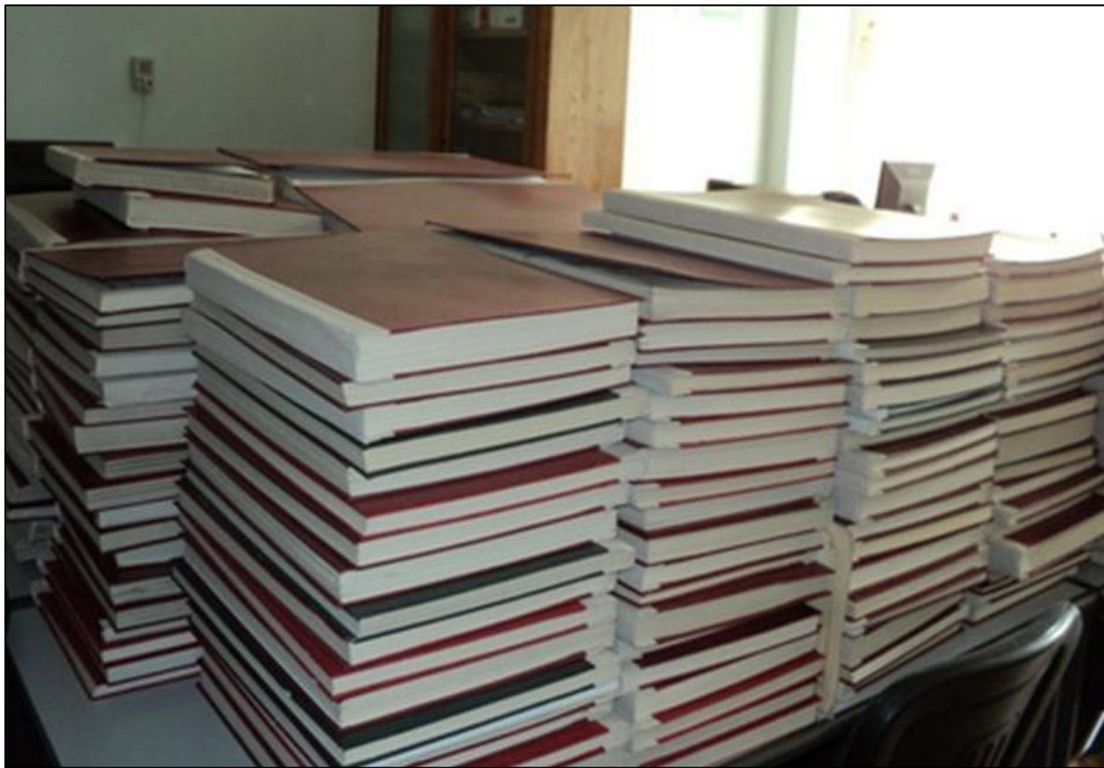
Традиционный переплёт в мастерских города