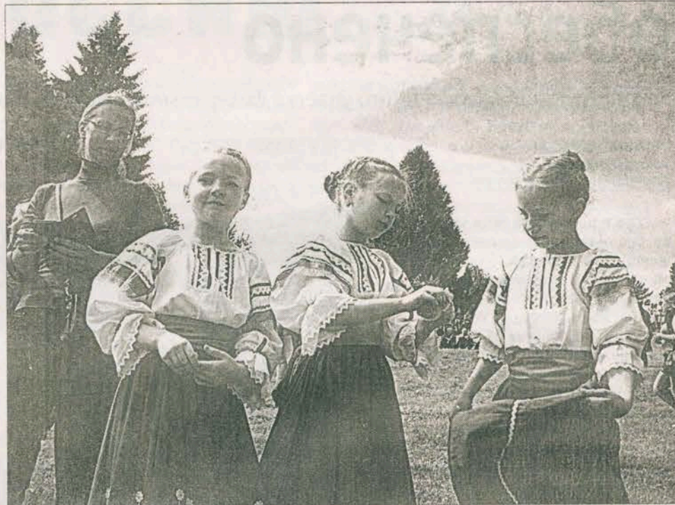
Готовимся к Троицкому хороводу

10 июня 2018 г. на территории музея деревянного зодчества под открытым небом в деревне Василево Торжокского района состоялся XXIII Межрегиональный фольклорный праздник «Троицкие гуляния».