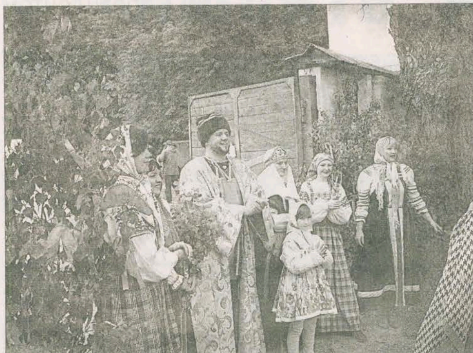
Радужная встреча у ворот усадьбы «Василево»