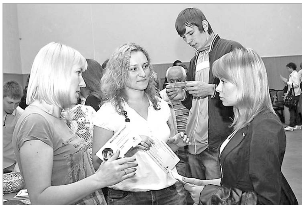
Содействие трудоустройству молодежи – один из ключевых вопросов профессиональной деятельности службы занятости

Кроме того, Минтрудом России одобрена региональная программа «Реализация дополнительных мероприятий в сфере занятости населения, направленных на снижение напряженности на рынке