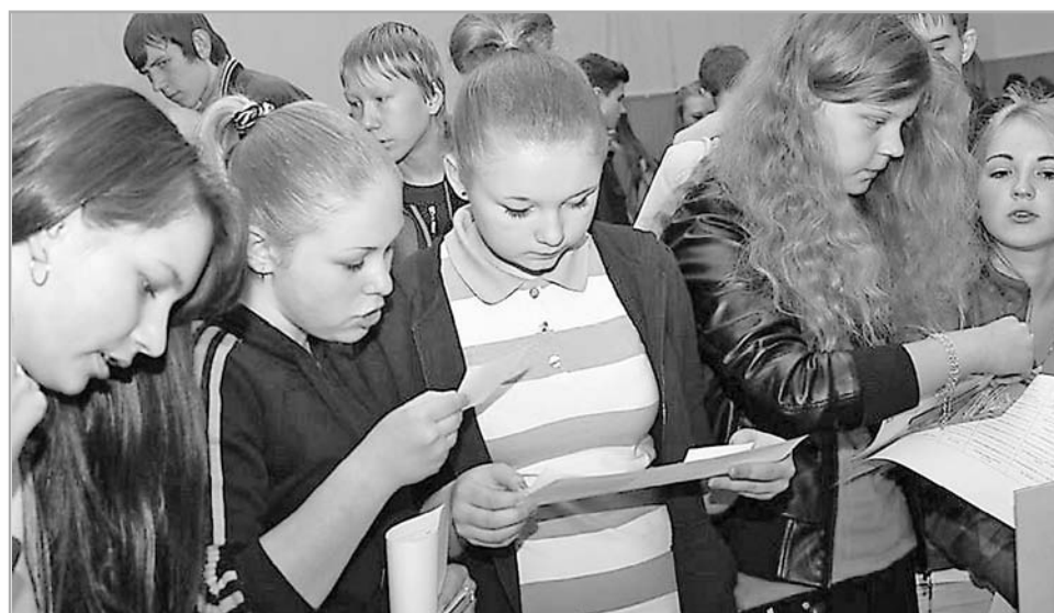
Большое внимание уделяется и занятости подростков в свободное от учебы время

В службе занятости Тверской области работают настоящие профессионалы, которые поддерживают, помогают восстановить или даже начать новый трудовой путь. Оперативность и ответственность сотрудников зачастую помогают стать участником сложных программ и направлений – трудовой мобильности, переобучения, содействия самозанятости. Равнодушные люди здесь не работают!