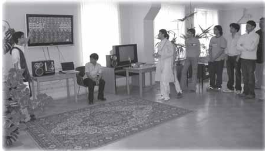
Дни индийской культуры

Году чтения был посвящен и круглый стол «Читающий мир». Что за книги любимы в разных странах? Какие жанры популярны? Какие книги предпочитает молодежь? Собравшиеся отвечали на серьезный, почти что «гамлетовский» вопрос: «Быть или не быть... книге? Читать или не читать?» «Пусть сюда приходят друзья!» – так поют члены лингвострановедческого клуба «АНЕФРА» на латинском языке в своем гимне «Amici venient huc». («Сюда приходят друзья»). И мы приглашаем всех стать нашими друзьями!