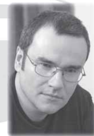
Дмитрий Зеленин, губернатор Тверской области

Областная универсальная научная библиотека им. А.М. Горького прочно закрепила за собой позиции крупнейшего информационного центра. Уверен, что высокий профессионализм, верность своему делу и богатый опыт работников библиотеки будут способствовать дальнейшему повышению интереса жителей области к культуре и истории, вносить весомый вклад в социально-экономическое развитие региона, и, как следствие, в повышение качества жизни населения Верхневолжья.