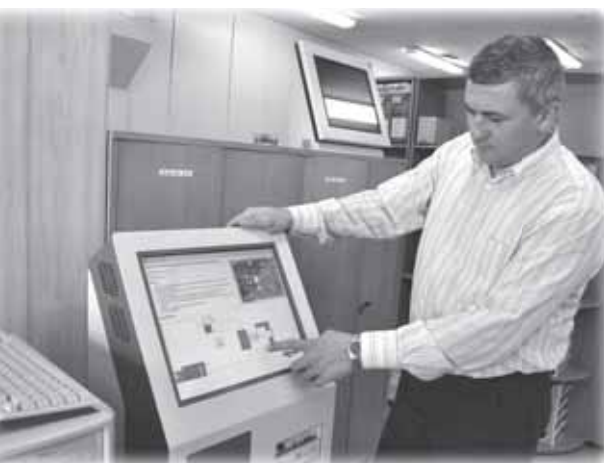
Электронный информационный киоск

Первые шаги Тверской региональной электронной библиотеки, информацию с первого съезда тверских библиотекарей, условия дальнейшего развития ДИЦ, в том числе сельских, бизнес-центров представили заместитель директора по вопросам автоматизации, заведующая отделом комплектования, заведующая методическим отделом, главный библиотечный деловой информационный центр Тверской ОУНБ.