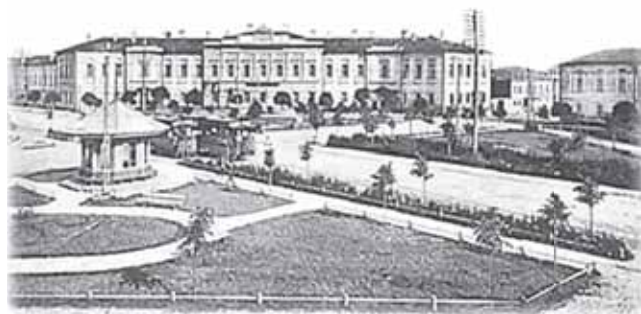
Губернское правление, где библиотека размещалась при своем основании – ныне Областная администрация

Бюджет библиотеки складывался из пожертвований частных лиц и платы за чтение. Большие усилия прилагались членами Попечительского комитета по приобретению новых изданий. Они обращались в редакции, библиотеки,