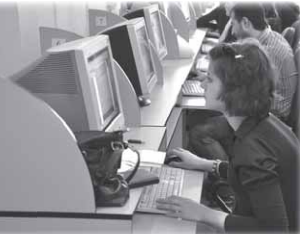
Электронный читальный зал

свою сеть, но и библиотеки другой ведомственной принадлежности, если они высказывают желание. Например, школьные, Тверское культурно-просветучилище им. Н. Львова, которое приобрело необходимый парк компьютеров и подключено к безлимитному Интернету.