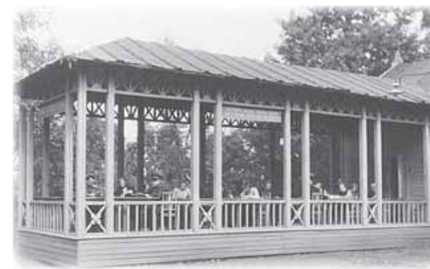
Летняя читальня в городском саду

Надо отметить, что в бюджете библиотеки значительную роль играли средства, которые она зарабатывала сама. Она получала плату за чтение, продавала учебники, переплеты для них, ноты, картины, Синодские издания, свои катало-