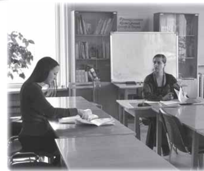
Индивидуальное занятие по грузинскому языку

С 1989 г. установили тесные контакты с обществом Эриха Марии Ремарка в г. Оснабрюке. А произошло это так. В 1988 г. проходили Дни культуры ФРГ в Калинин. В это время профессор