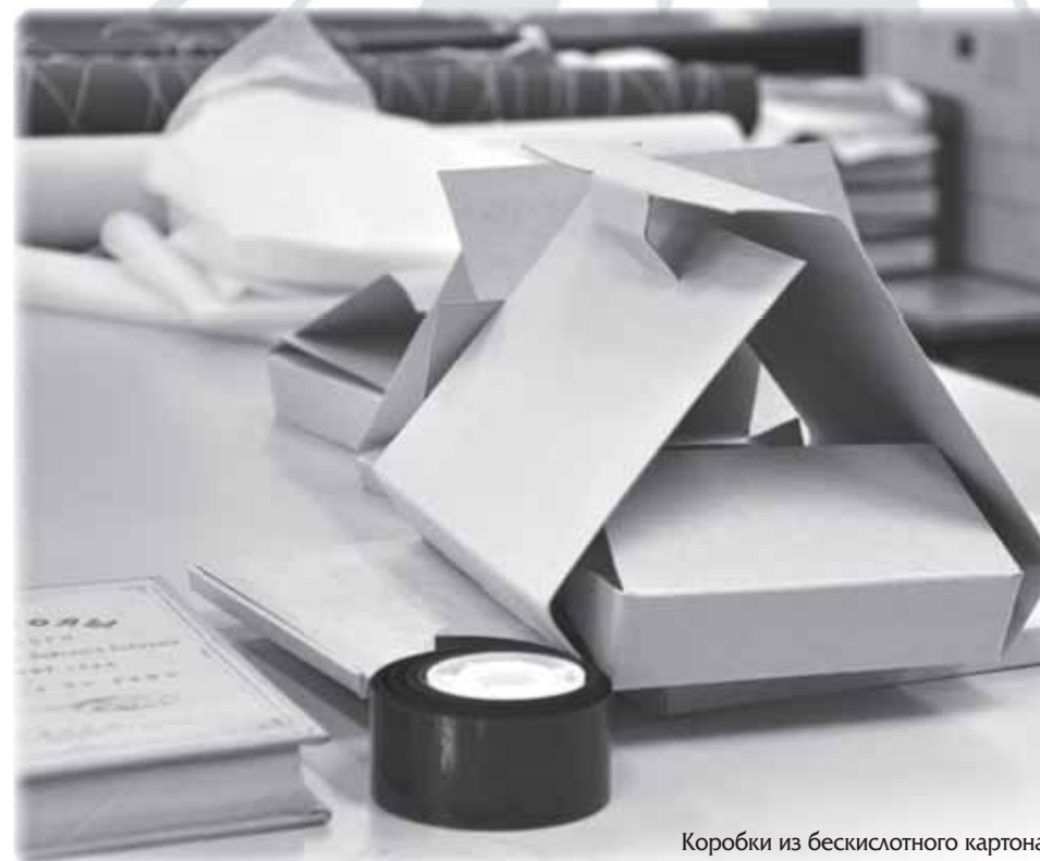
Коробки из бескислотного картона

О тдел консервации библиотечных фондов организован в 2006 г. на базе сектора гигиены и реставрации и осуществляет свою деятельность при поддержке Министерства культуры Российской Федерации, департамента культуры Тверской области в рамках «Национальной программы сохранения библиотечных фондов Российской Федерации» и «Программы сохранности библиотечных фондов Тверской ОУНБ им. А.М. Горького». Отдел отвечает за целый комплекс работ по сохранности. Это мониторинг режима хранения и обследование библиотечных фондов, реставрация печатных изданий, переплетные работы, формирование паспорта состояния фонда редких изданий, создание электронных и печатных копий документов, просветительская работа среди читателей и библиотекарей, оказание методической, организационной и консультационной помощи библиотекам области по вопросам сохранности изданий.