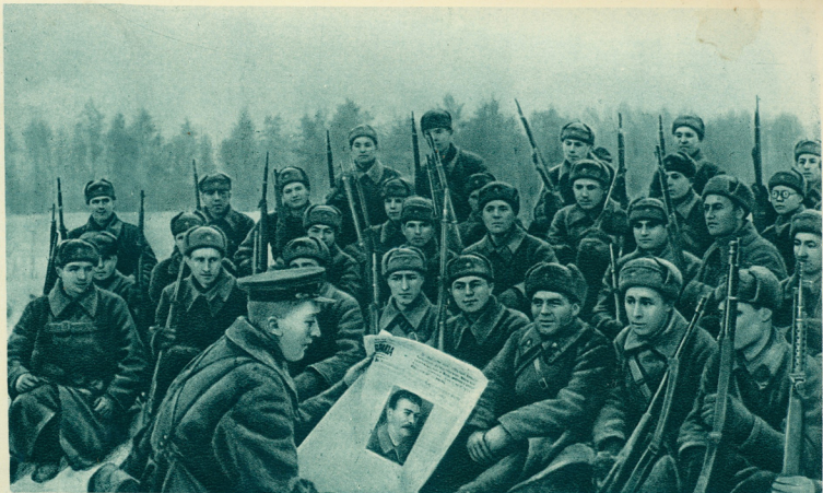
БОЙЦЫ N-СКОЙ ЧАСТИ ЧИТАЮТ ДОКЛАД ТОВАРИЩА СТАЛИНА