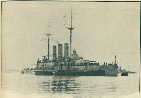
Флагманскій корабль Черноморскаго флота «Евстафій», сражавшійся 5 ноября съ турецкимъ крейсеромъ «Гебенъ».